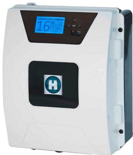
Aquarite Flo sóbontó