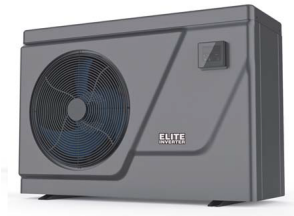
Elite Inverter hőszivattyú